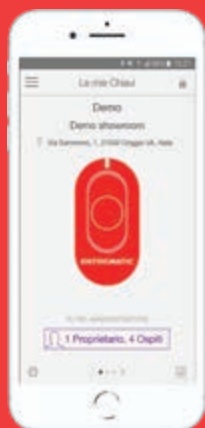
app SCLAK iOS 9+ en Android 4.3.1+

(2) Download de app SCLAK in de Apple of Google Stores.