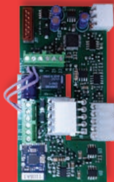
elektronische kaart, compatibel met alle panelen van Entrematic

(1) Installeer de elektronische kaart (MOBCRE) in de desbetreffende plaats van het besturingspaneel Entrematic of in de kaarthouderbasis CONT1.